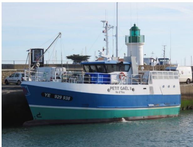
Le Petit Gaël II

Il est possible de prendre plusieurs colis par contrat.