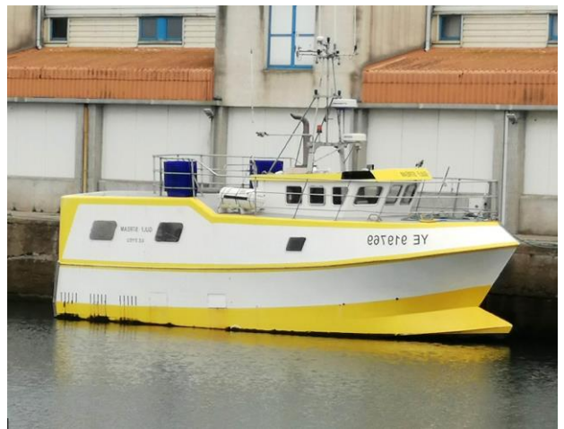
Le Gulf Stream

L'inscription est en règle générale effectuée entre juin et septembre pour une année, c'est à dire pour 9 ou 10 distributions (septembre ou octobre à juin).